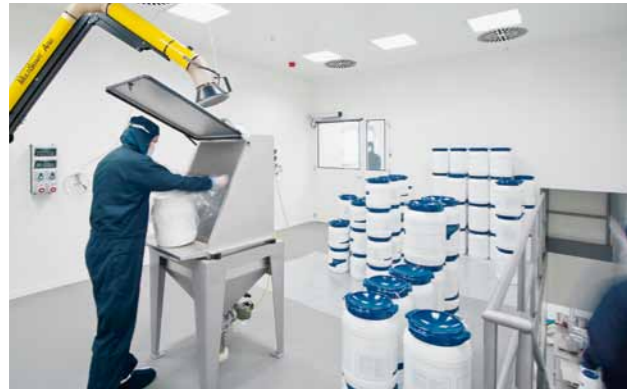
Aufgabestation im Obergeschoss des Reinraums

zesstechnik die Verfahren vom Versuchsmaßstab zur Serienproduktion („Scale-up“). Qualitätskontrollen und umfassende technische Dokumentationen sind feste Bestandteile dieser Projekte. Ein weiterer Arbeitsschwerpunkt der Abteilung ist die Produktion von hoch-