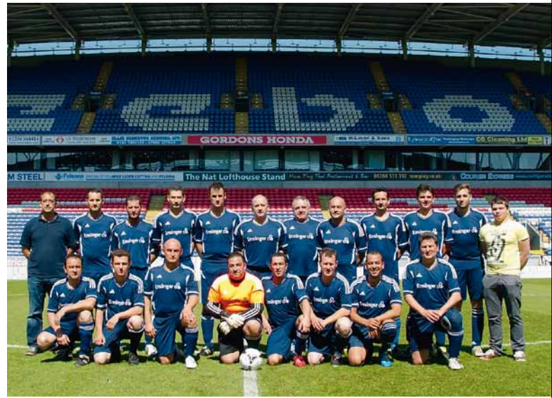
Das Erstligastadion der Bolton Wanderers fasst 30.000 Zuschauer

Ehrenplatz in Nufingen finden wird. Den Sonntagmorgen verbrachten die Teams in Liverpool mit einem gemeinsamen Besuch des Beatles-Museums, bevor mit dem Rückflug ein ebenso unterhaltsamer wie erfolgreicher Besuch bei unseren englischen Kollegen zu Ende ging.