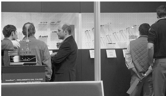
Reges Interesse an den Produkten vor den Vitrinen. Davor zwei Podeste mit Wärme-Kälteversuchen, die die praktische Wirkung unterschiedlicher Isolierungen von Fenstern auf einfache Weise demonstrieren.

[Wey] Mit einem Besucherzuwachs von über 6,5% zur letzten Veranstaltung konnte die diesjährige SAIE DUE, die vom 16. bis 20. März in Bologna stattgefunden hatte, einen neuen Rekord vermelden.