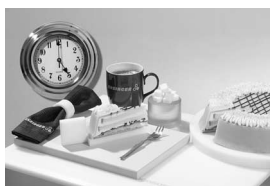
Zuschnitte zum Kaffee: Wenn's noch bis zum Nachmittag reicht, werden die Zuschnitte gegen einen geringen Aufpreis bis um 17 Uhr geliefert.

„Schnelle Lieferfähigkeit bestimmt unseren Arbeitsalltag und den reibungslosen Ablauf von Produktionsprozessen. Der Bedarf an kurzfrist-