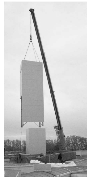
Im neuen, 12 Meter hohen Lagerturm wurden 10 Tonnen Stahl verbaut. Der maßgeschneiderte Stahlmantel schützt den Turm vor Wind und Wetter.

regallager einen hocheffektiven Produktionsfaktor geschaffen, der das Prinzip der prozessoptimierten Auftragsbearbeitung im Bereich Bauprodukte in idealer Weise ergänzt.