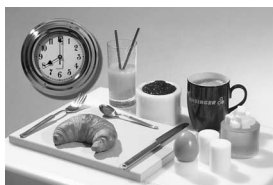
Zuschnitte zum Frühstück: Brandheiße Zuschnitte werden gegen Aufpreis schon am Werktag nach der Bestellung um 8 Uhr morgens geliefert.

[DW] Nicht immer ist alles vorhersehbar und planbar, und manchmal kommt es bei der Ersatzteilbeschaffung auf jede Stunde an. Mit kurzfristigen Liefermöglichkeiten – insbesondere bei Zuschnitten – möchte ENSINGER den Kunden in seinem Produktionsablauf unterstützen. Genau für solche Fälle, wenn die Kunden ihre Zuschnitte just-in-time benötigen, hat der Kunststoff-Hersteller den À-la-carte-Service eingerichtet: Ab sofort sind Zuschnitte bis zu bestimmten Mengen schon am nächsten Tag wahlweise zur Frühstück- oder zur Kaffeezeit beim Kunden. Gegen einen geringen Aufpreis kann der Besteller nun selbst festlegen, wann geliefert werden soll: Um acht Uhr oder um 17 Uhr. Zudem bietet ENSINGER unentgeltlich an, Zuschnitte bis zu 100 Stück unter bestimmten Voraussetzungen innerhalb von 24