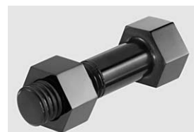
Außergewöhnlich gute Zerspanbarkeit bis auf geringste Toleranzen zeichnet den Werkstoff aus.

farbig eloxierte Aluminiumwerkstoffe durch alkalische Reiniger angegriffen und schnell entfärbt. Die ENSINGER-Werkstoffe TECAFORM AH MT und TECASON P MT bieten eine breite Farbpalette in den gängigen Größen. Die Kunststoffe zeichnen sich aus durch ihre gute Beständigkeit gegen Reinigungs- und Desinfektionsmittel und gegen zahlreiche Lösungsmittel. Sie sind mit den gängigen Sterilisationsmethoden gut sterilisierbar. Weitere Merkmale sind die gute Festigkeit, Steifigkeit und Zähigkeit des Materials sowie die geringe Wasseraufnahme. TECAFORM AH MT und TECASON P MT sind beide sehr gut elektrisch isolierend. Außerdem erfüllen sie für die Medizintechnik relevante Voraussetzungen: Sie sind FDA-konform und erfüllen die Anforderungen der Biokompatibilität.