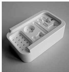
Instrumentenbehälter aus TECAPRO SAN.

Mit antimikrobiellem Additiv ausgerüstetes Polyacetal und Polypropylen bietet zusätzliche Sicherheit in der Medizintechnik und Lebensmittelverarbeitung. TECAFORM SAN und TECAPRO SAN erreichen ihre antimikrobielle Wirkung durch die Freisetzung von Silber-Ionen und bieten dadurch folgende Vorteile: Sie wirken gleichermaßen auf grampositive wie gramnegative Bakterien. Die Funktionsweise beruht auf physikalischer Schädigung der Zellen, daher bildet sich keine Resistenz, wie dies oft bei organischen Wirkstoffen passiert. Der Wirkstoff ist homogen im Kunststoff verteilt, dadurch ist die Wirkung auch bei Abrieb gewährleistet. Der Wirkstoff geht nicht verloren, daher