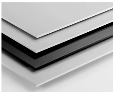
Flammhemmendes TECAMID 6 FR T in dünnen Platten.

Brand- und Flammenschutz ist ein wichtiges Thema im Transportwesen. Speziell für diesen Einsatz wurde das halogenfreie flammgeschützte Polyamid TECAMID 6 FR T entwickelt. In Zügen, Bussen, auf Schiffen, überall, wo in Transportmitteln flammhemmende Materialien bei gleichzeitiger Stabilität gefragt sind, kann dieses neue Material zum Einsatz kommen.