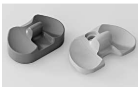
Probekörper für die Kniegelenk-Chirurgie, farbcodiert für verschiedene Passgrößen.

Farbige Kunststoffe sind in der Medizintechnik gebräuchlich, z. B. um verschiedene Instrumente und Größen leicht unterscheiden zu können. Wichtig ist dabei, dass die Farben auch nach mehrfacher Sterilisation möglichst konstant bleiben und die Richtlinien für den Einsatz in der Medizintechnik erfüllen. An vielen Stellen können die Kunststoffe ihre hervorragende Korrosionsbeständigkeit gegenüber Metallen demonstrieren. So werden z. B.