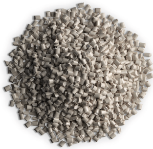
TECACOMP PEEK MED LDS grey Granulat

Die hellgraue Eigenfarbe von TECACOMP PEEK MED LDS entspricht auch den Anforderungen der Medizinbranche nach einer klaren, hellen Farbgebung. TECACOMP PEEK MED LDS ist als Granulat verfügbar oder kann über unseren Partner LITE GmbH auch als Folie bis zu einer minimalen Stärke von 100µm geliefert werden.